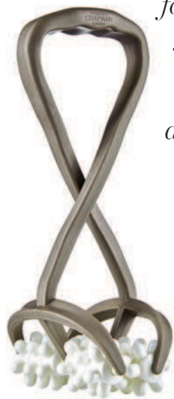
SEPAI. Tune It V6.6 Elast (69 €). SENSILIS Eternalist A.G.E. Neck, Neckline & Arms (50 €). SARAH CHAPMAN Body Lift (41 €). GLO Masajeador 910 (299 €).

El teletrabajo ha provocado el aumento de las consultas médicas por dolores de espalda. Para evitarlo los expertos aconsejan sentarse con la espalda recta, pero sin forzarla, con caderas y rodillas a 90°, y colocar la pantalla del ordenador a la altura de los ojos.