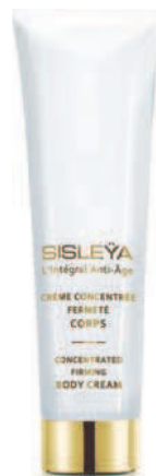
DELBOVE Cryostimulist Intense Firming Arm Cream (46 €). FENTY SKIN Buff Ryder Exfoliante Corporal (27 €). SISLEYA L'Intégral Anti-Âge Concentrated Firming Body Cream (201,75 €). ISDIN Acniben Body (18,25 €).